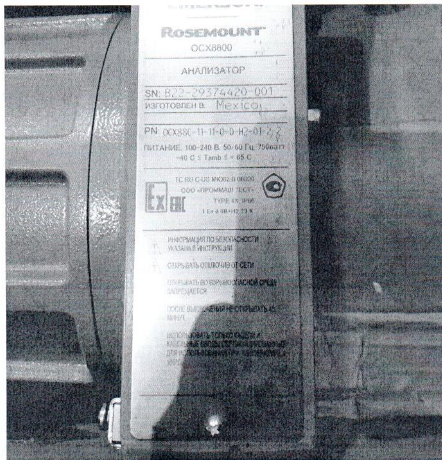
Рисунок 1.2 – Фотография маркировки газоанализатора OX8800 (OXC88C-11-11-0-0-H2-01-2-2) № B22-29374420-001