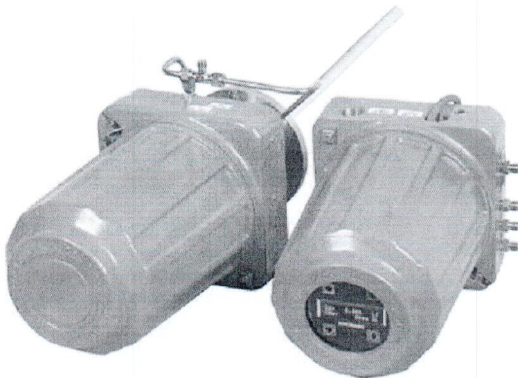
Рисунок 1.1 – Фотография общего вида газоанализатора ОСХ 8800 (ОСХ88С-12-11-0-0-Н2-02-1-3) № D21-26237141-001