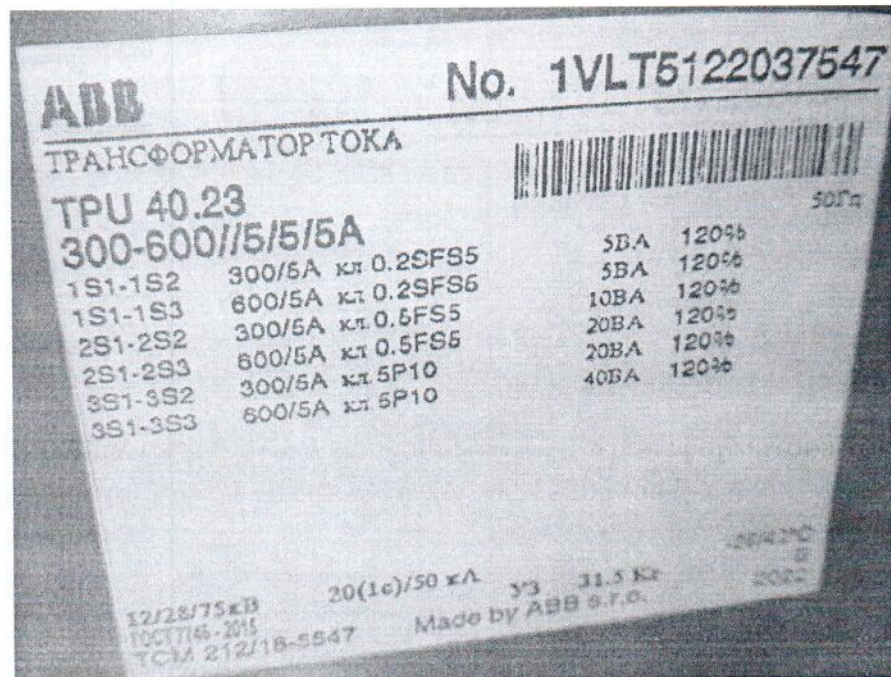
Рисунок 1.2 – Фотография маркировки трансформатора тока TRU 40.23 № 1VLT5122037547