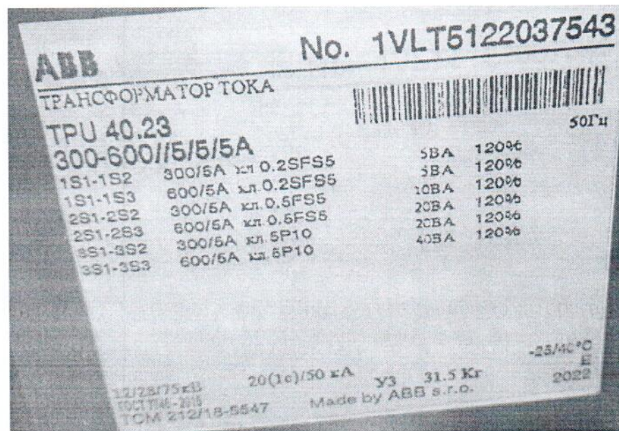
Рисунок 1.2 – Фотография маркировки трансформатора тока TRU 40.23 № 1VLT5122037543