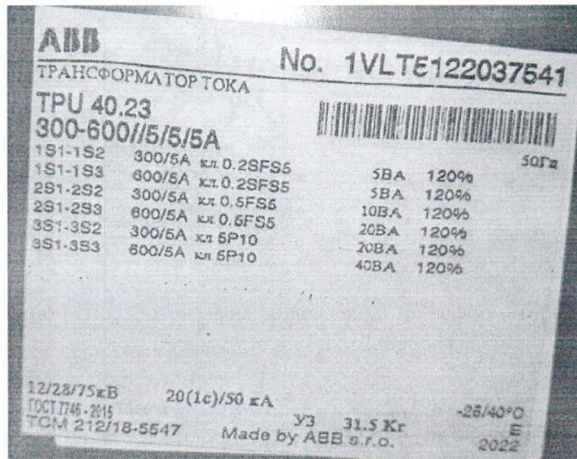
Рисунок 1.2 – Фотография маркировки трансформатора тока TPU 40.23 № 1VLT5122037541