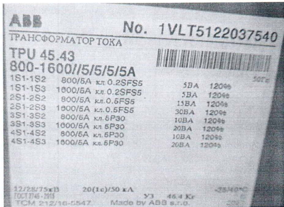
Рисунок 1.2 – Фотография маркировки трансформатора тока TPU 45.43 № 1VLT5122037540