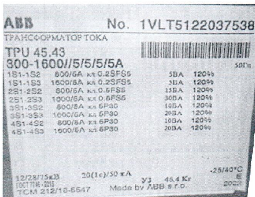
Рисунок 1.2 – Фотография маркировки трансформатора тока TPU 45.43 № 1VLT5122037538