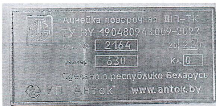
Рисунок 1.2 – Фотография маркировки линеек поверочных ШП-ТК