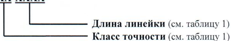
Рисунок 1 - Условное обозначение линеек