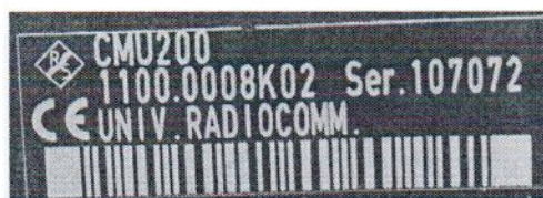
Рисунок 1.2 – Фотография маркировки тестера радиокommunikационного CMU 200 № 107072