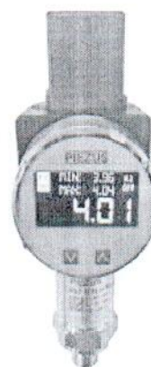
Рисунок -4 Общий вид датчиков давления емкостных ASZ