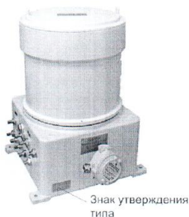
Рисунок 2: Внешний вид блока аналитического