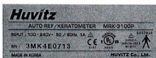
Рисунок 1.2 – Фотография маркировки авторефрактокератометра MRK-3100P № 3МК4Е0713