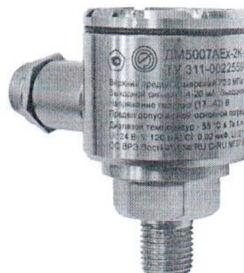
Рисунок 5 – Датчик давления ДМ5007АЕх-2К

Пломбирование датчиков давления ДМ5007 не предусмотрено. Нанесение знака поверки на корпус датчика не предусмотрено. Заводской номер наносится на табличку, прикрепленную к датчику, методом гравирования или типографским способом и в паспорт типографским способом. Место нанесения знака утверждения типа указано на рисунке 6. Место нанесения заводского номера указано на рисунке 7.