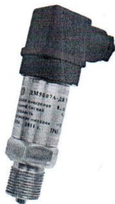
Рисунок 1 – Датчик давления ДМ5007А