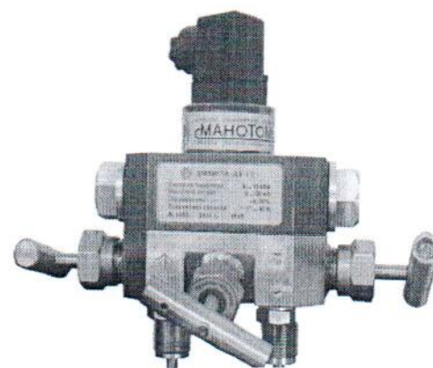
Рисунок 3 – Датчик давления ДМ5007А-ДД