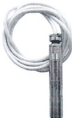
Рисунок 4 – Датчик давления ДМ 5007А-ДА-П У2