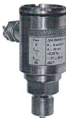
Рисунок 2 – Датчик давления ДМ5007Ех