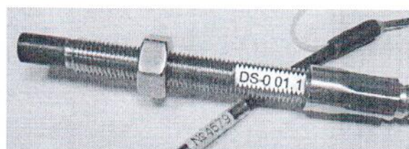
Рисунок 2 – Общий вид вихрековых преобразователей DS-0, DS-1, DS-2, DS-3