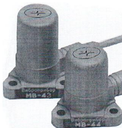
Рисунок 4 – Общий вид вибропреобразователей МВ-43 и МВ-44.