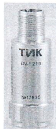
Рисунок 3 – Общий вид вибропреобразователя DV-1