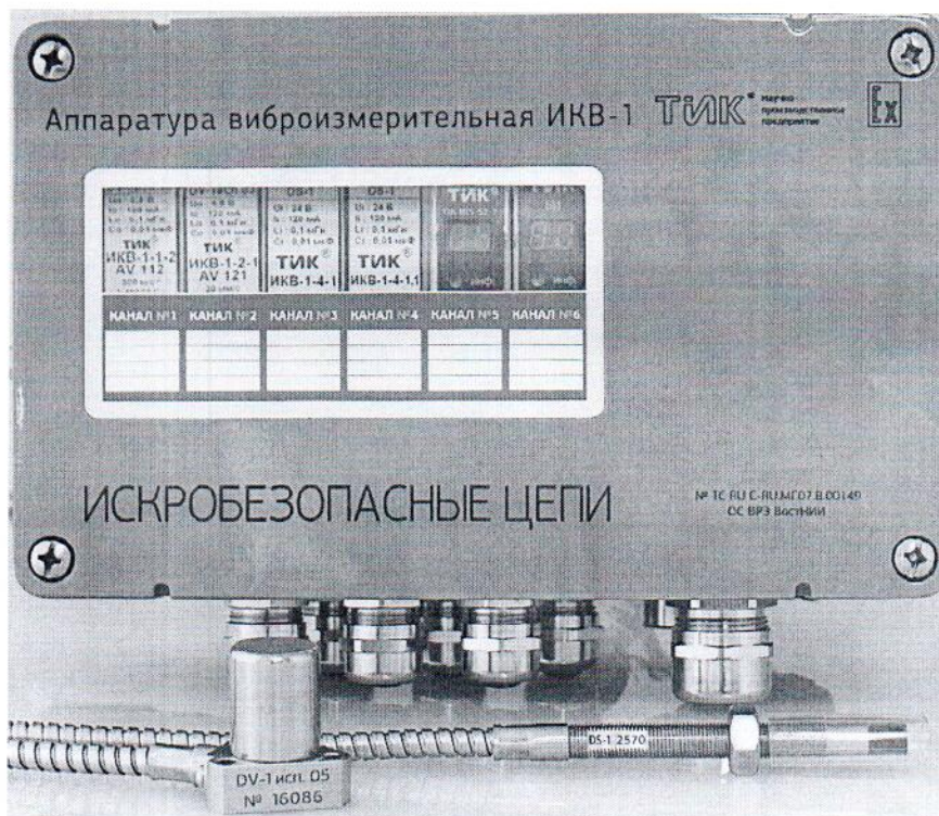
Рисунок 1 - Общий вид аппаратуры виброизмерительной ИКВ-1

Общие виды вихрековых преобразователей DS-0, DS-1, DS-2 и DS-3, вибропреобразователя DV-1, вибропреобразователей МВ-43 и МВ-44 представлены на рисунках 2, 3 и 4.