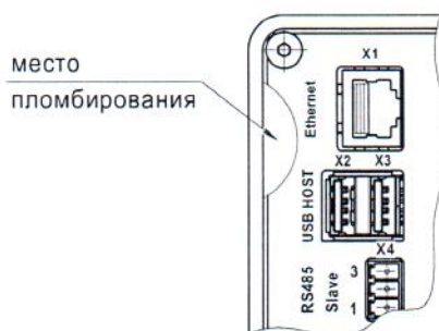
Рисунок 2 - Схема пломбировки от несанкционированного доступа