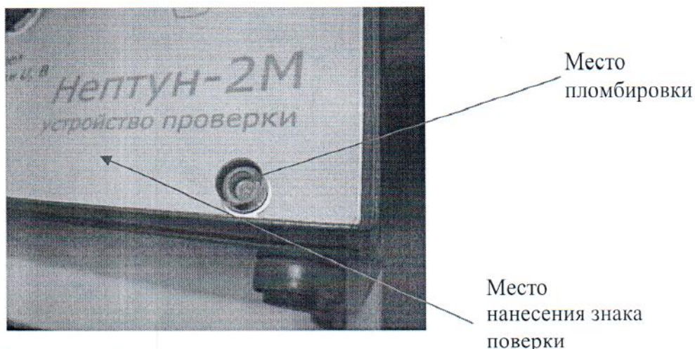
Рисунок 2 - Место пломбировки от несанкционированного доступа и нанесения знака поверки