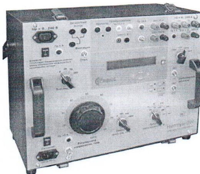
Рисунок 1 - Общий вид устройства проверки простых защит «Нептун-2М»

Место пломбировки от несанкционированного доступа, обозначение места нанесения знака поверки представлены на рисунке 2.