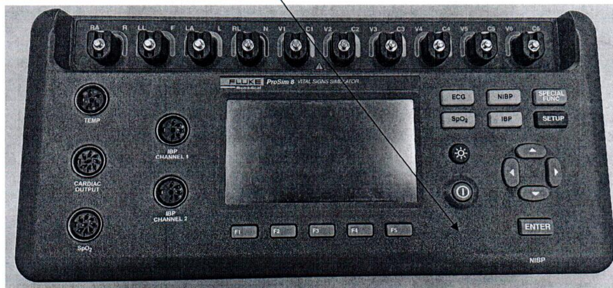
Рисунок 2.1 – Схема (рисунок) с указанием места для нанесения знака поверки на генератора сигналов пациента Fluke ProSim 8 № 4814020