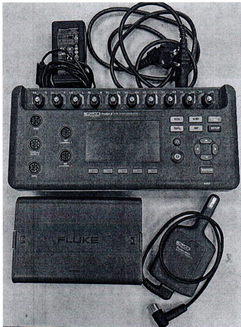
Рисунок 1.1 – Фотография общего вида генератора сигналов пациента Fluke ProSim 8 № 4814020