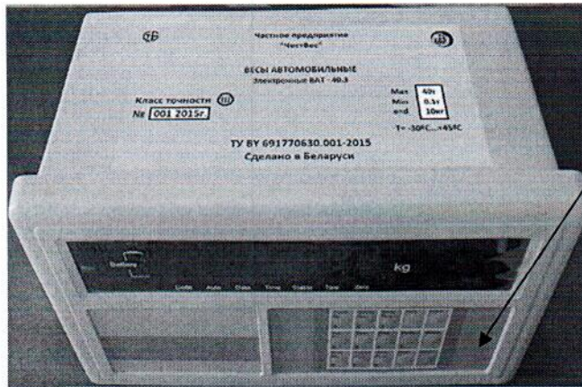
Схема (рисунок) с указанием места для нанесения знака поверки средств измерений