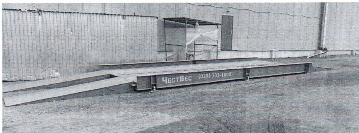
Рисунок 1.1 – Фотографии общего вида весов автомобильных электронных ВАТ (изображение носит иллюстративный характер)