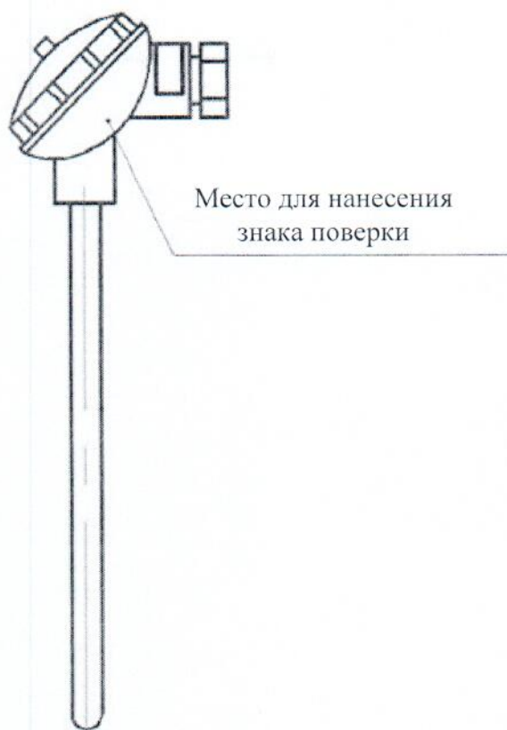
Рисунок 2.1 – Схема (рисунок) с указанием места для нанесения знака поверки средств измерений на термопары с клеммной головкой

Схема (рисунок) с указанием места для нанесения знака поверки средств измерений