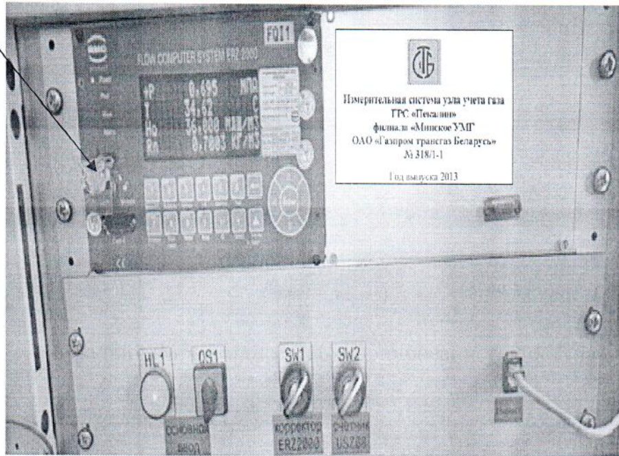
Рисунок 3.1 – Схема пломбировки от несанкционированного доступа

Схема пломбировки от несанкционированного доступа