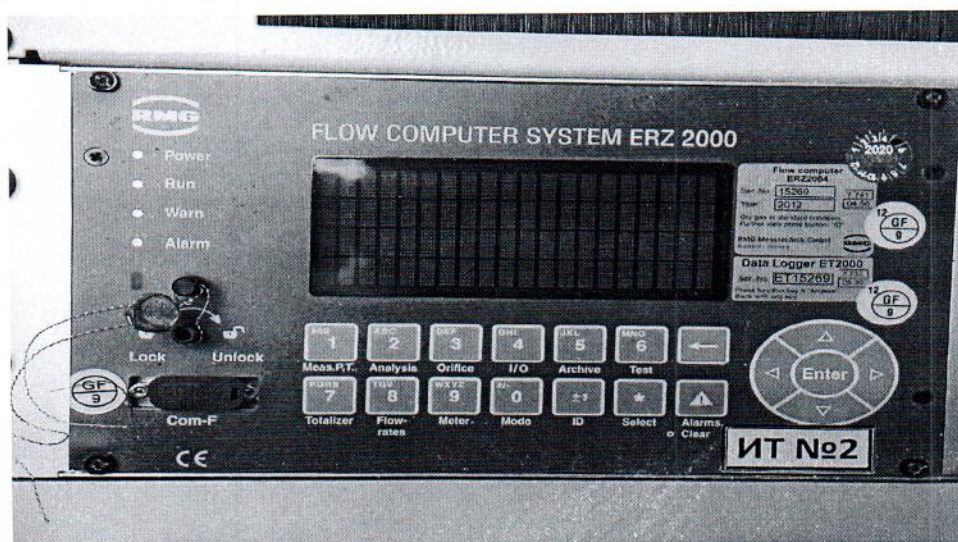
Рисунок 1.1 – Фотографии общего вида ИС УУГ (изображение носит иллюстрационный характер)