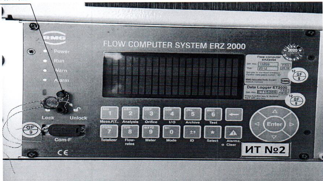
Рисунок 3.1 – Схема пломбировки от несанкционированного доступа

Место пломбировки от несанкционированного доступа