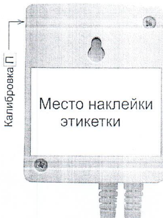
Рисунок 2 – Фотография мест для пломбирования сигнализаторов загазованности