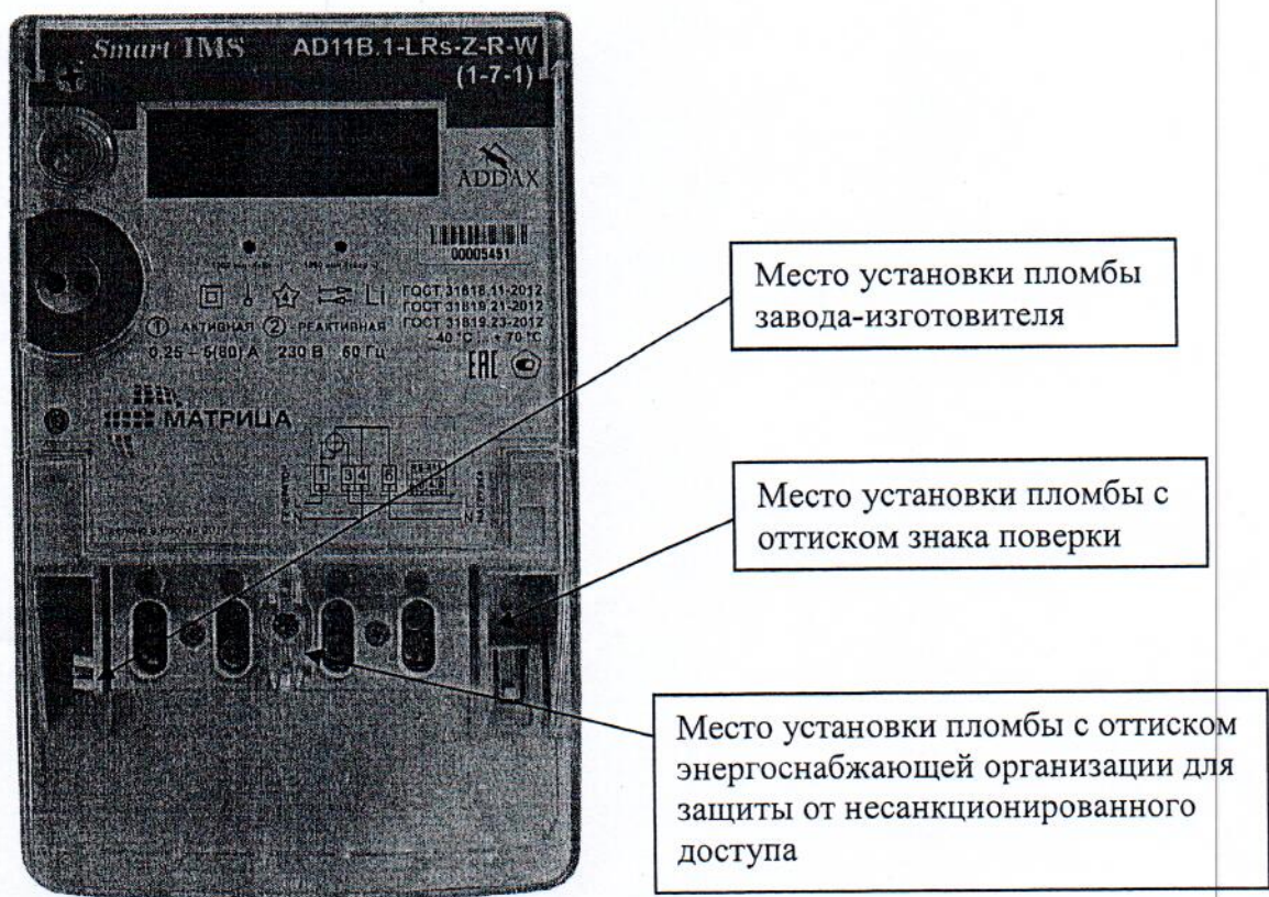
Рисунок 2 - Общий вид счетчика и схема пломбировки от несанкционированного доступа в корпусе типа «классический тонкий», разрушаемом при вскрытии