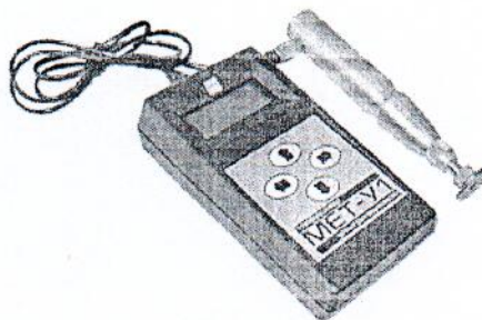
Рисунок 1 – Внешний вид твердомера МЕТ-У1

Внешний вид твердомера МЕТ-У1 приведён на рисунке 1, схема пломбировки от несанкционированного доступа на рисунке 2.