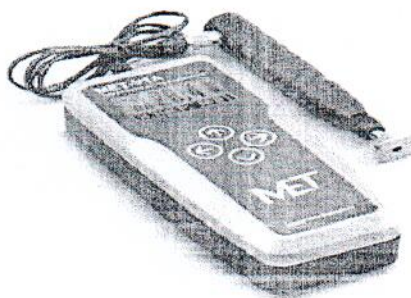
Рисунок 3 – Внешний вид твердомера MET-U1A