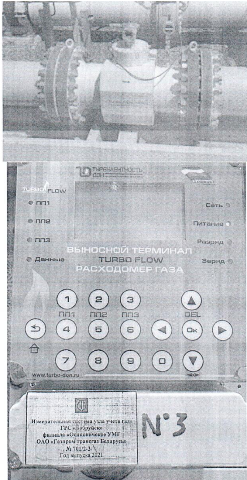
Рисунок 1.1 – Фотографии общего вида ИС УУГ

Фотографии общего вида средств измерений