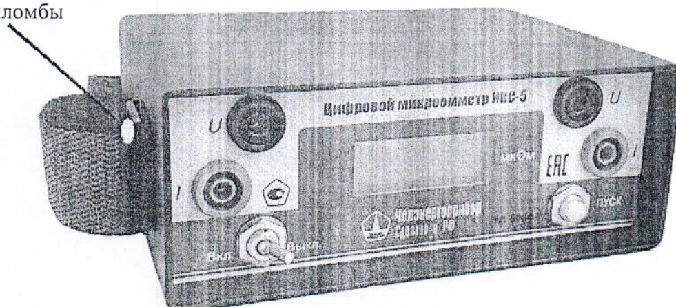
Рисунок 4 – Внешний вид микроомметра ИКС-5 исполнение 3