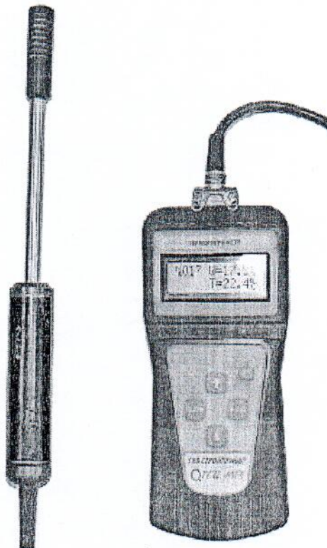
Рисунок 1. Внешний вид термогигрометра ТГЦ-МГ4

Термогигрометры ТГЦ-МГ4 (далее – термогигрометры) представляют собой автоматические приборы непрерывного действия, основанные на измерении емкости и сопротивления датчиков первичного преобразователя в зависимости от относительной влажности и температуры анализируемой среды и выполненные в виде электронного блока, к которому с помощью удлинительного кабеля подключается измерительный преобразователь. Первичный преобразователь включает в себя датчики влажности и температуры и предназначен для преобразования температуры и влажности в электрические сигналы, которые передаются в электронный блок. Электронный блок преобразует электрические сигналы, поступающие с первичного преобразователя в показания относительной влажности и температуры, отображаемые на цифровом дисплее. Термогигрометры выпускаются в двух модификациях: ТГЦ-МГ4 и ТГЦ-МГ4.01. Модификация ТГЦ-МГ4.01 дополнительно снабжена интерфейсом RS-232 и функцией записи измеряемых параметров в собственную энергонезависимую память с целью последующей передачи данных на компьютер. Внешний вид термогигрометра представлен на рисунке 1.