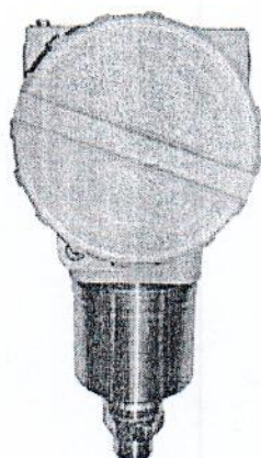
Рисунок 3 - Общий вид датчиков давления тензорезистивных AMZ