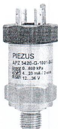
Рисунок 1 - Общий вид датчиков давления тензорезистивных APZ