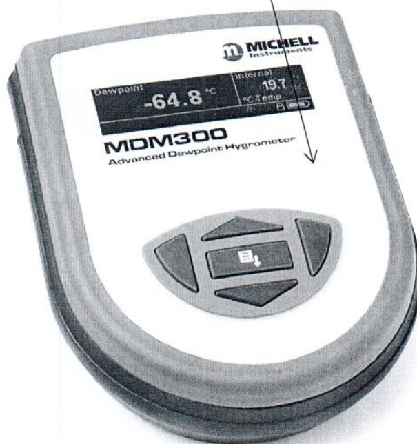
Рисунок 2.1 – Схема (рисунок) с указанием места для нанесения знака поверки средств измерений