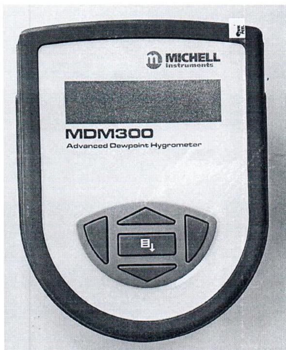
Рисунок 1.1 – Общий вид гигрометра MDM300 № 175736