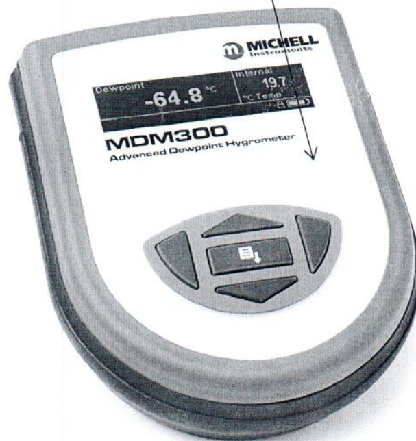
Рисунок 2.1 – Схема (рисунок) с указанием места для нанесения знака поверки средств измерений