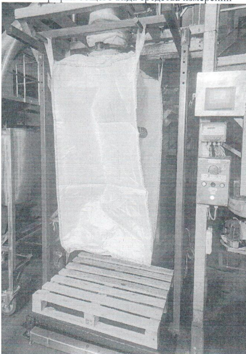
Рисунок 1.1 – Внешний вид дозатора весового ДВББ-1000 №1297

Фотография общего вида средства измерений