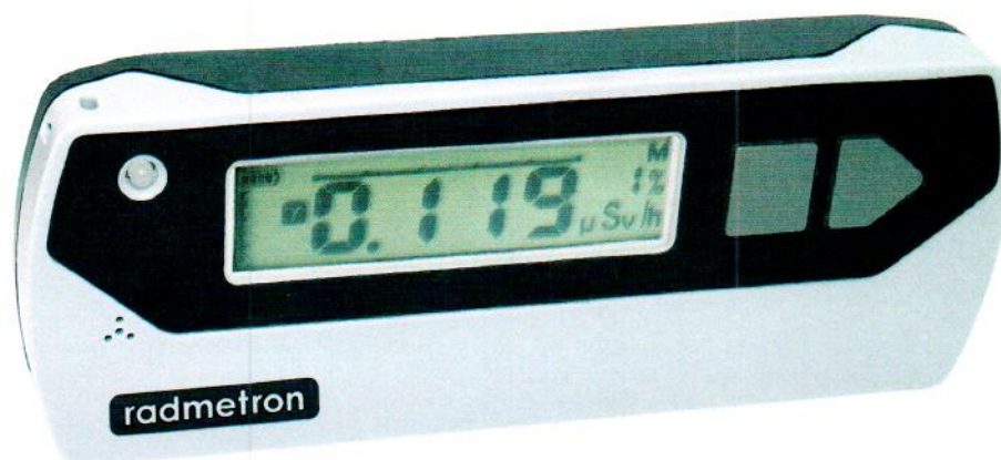
Рисунок 1.1 – Фотография общего вида дозиметров (изображение носит иллюстративный характер)

Фотография общего вида средств измерений