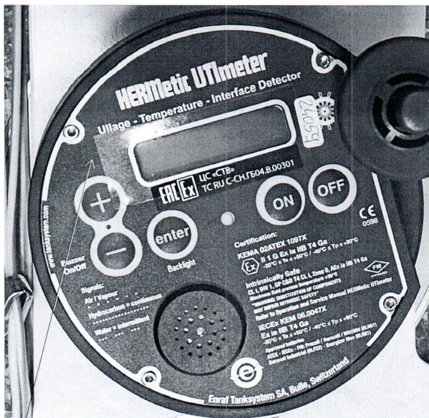
Схема (рисунок) с указанием места для нанесения знака поверки средств измерений