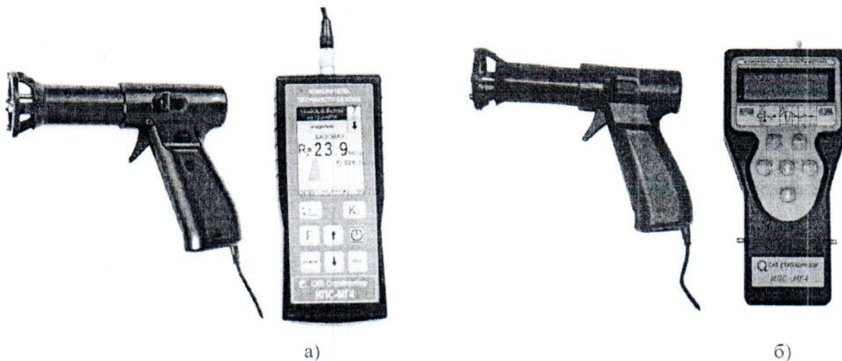
Рисунок 1 а, б – Общий вид измерителя прочности бетона мод. ИПС-МГ4.01 и ИПС-МГ4.03