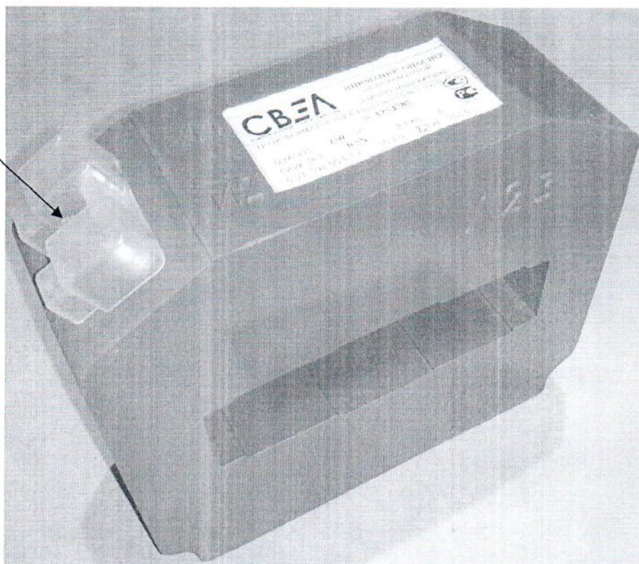
Рисунок 1 - Общий вид трансформаторов тока ТШЛ-СВЭЛ-0,66