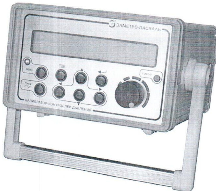
Рисунок 1 – Общий вид КД