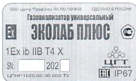
Рисунок 2 – Идентификационная табличка газоанализаторов