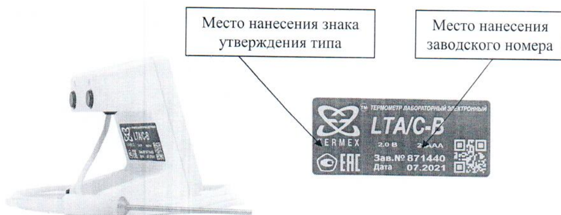
Рисунок 2 – внешний вид термометра с неразъемным соединением датчика к электронному блоку и его пломбировочная наклейка с указанием мест нанесения знака утверждения типа и заводского номера