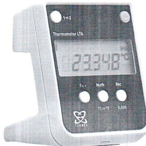
Рисунок 3 - внешний вид электронного блока термометра с секундомером

Пломбирование термометров осуществляется путем наклеивания на тыльную сторону электронного блока пломбировочной наклейки с маркировкой.