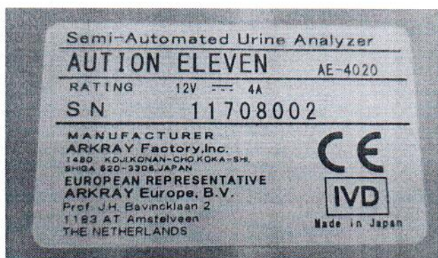
Рисунок 1.2 – Фотография маркировки анализатора мочи автоматического: анализатор мочи AUTION ELEVEN AE-4020 с принадлежностями № 11708002