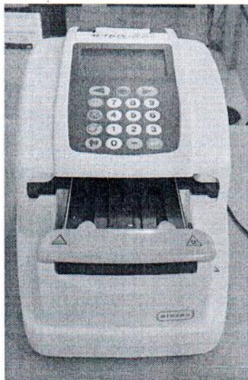
Рисунок 1.1 – Фотография общего вида анализатора мочи автоматического: анализатор мочи AUTION ELEVEN AE-4020 с принадлежностями № 11708002