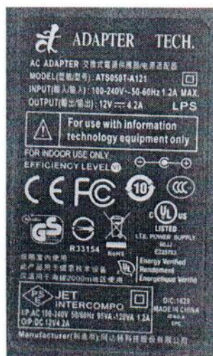
Рисунок 1.3 – Фотография маркировки сетевого адаптера анализатора мочи автоматического: анализатор мочи AUTION ELEVEN AE-4020 с принадлежностями № 11708002