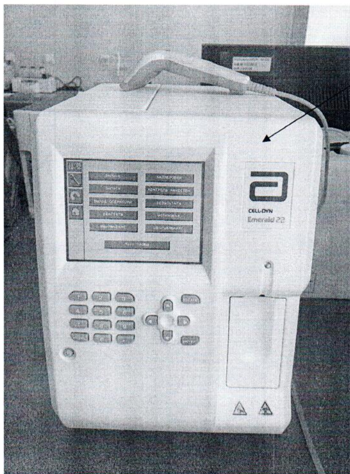
Схема (рисунок) с указанием места для нанесения знака поверки средств измерений