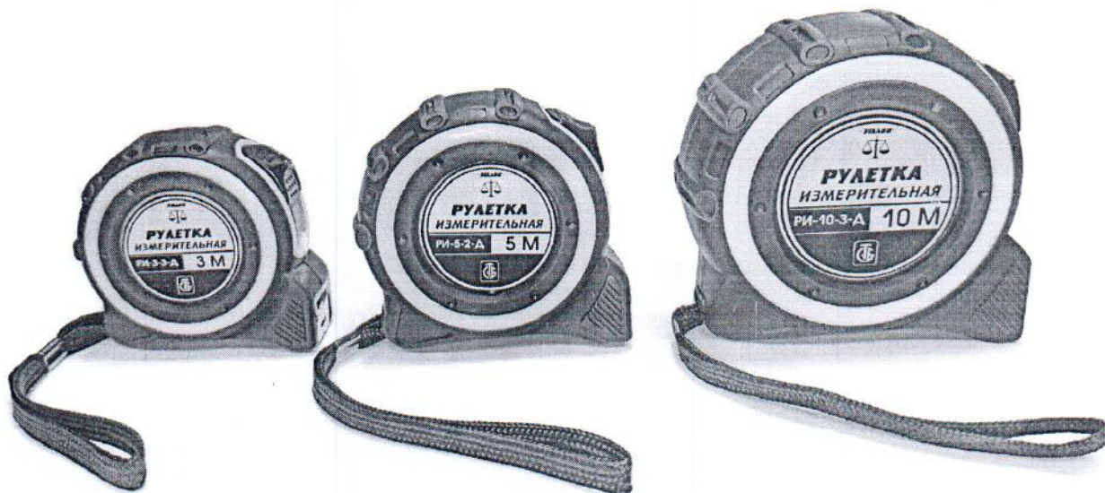
Рулетка измерительная РИ-3-3-Д

Фотографии общего вида средства измерений