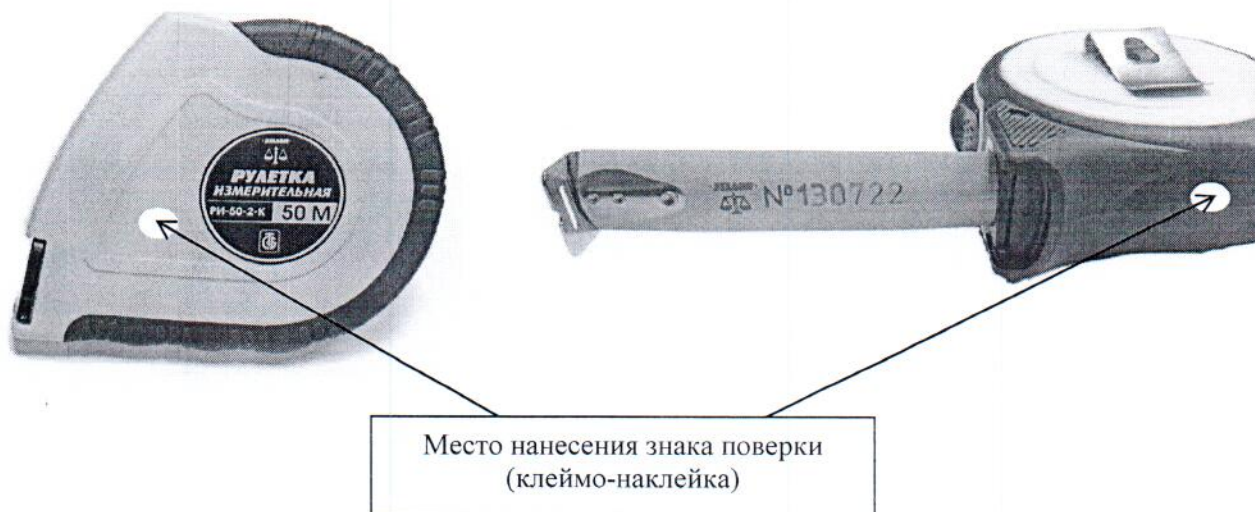
Рисунок 2 - Место для нанесения знака поверки средств измерений

Рулетки измерительные типа РИ-3, РИ-5, РИ-10