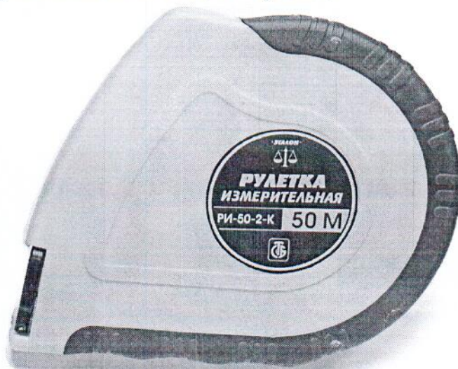
Рулетка измерительная РИ-50-2-К