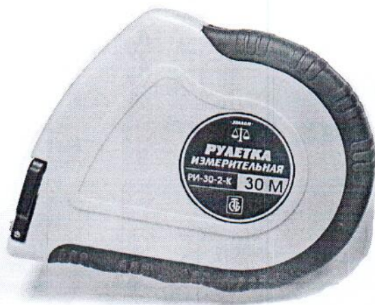
Рулетка измерительная РИ-30-2-К

Маркировка рулеток измерительных типа РИ-3, РИ-5, РИ-10