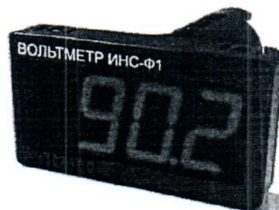
Общий вид приборов в корпусе Щ9 Рисунок 2

Приборы изготавливаются в нескольких вариантах исполнений, отличающихся друг от друга диапазоном измерений, конструкцией корпуса, напряжением питания.