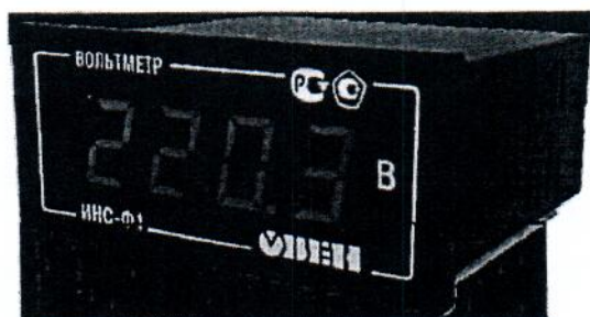
Общий вид приборов в корпусе Щ3 Рисунок 1

Фотографии общего вида приборов приведены на рисунках 1 и 2.