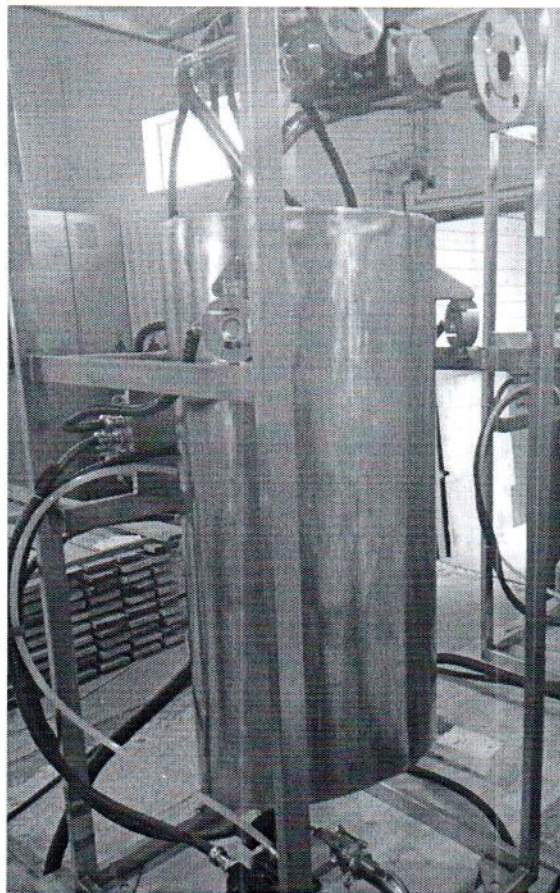
Рисунок 1.1 – Фотография общего вида установки дозирования жидкости весовой УДВ-1-100-Е № 1186