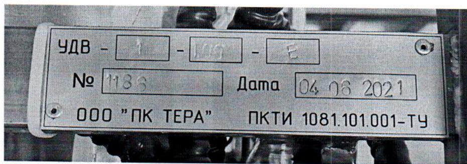
Рисунок 1.2 – Фотография маркировки установки дозирования жидкости весовой УДВ-1-100-Е № 1186