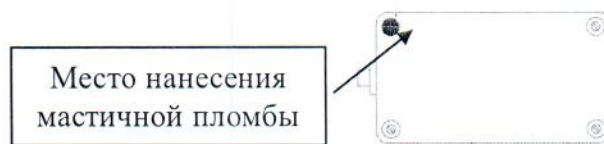
Рисунок 3 – Схема пломбировки корпуса преобразователя