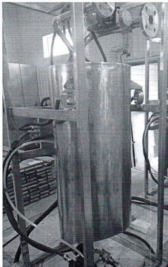
Рисунок 1.1 – Фотография общего вида установки дозирования жидкости весовой УДВ-1-100-Е № 1189