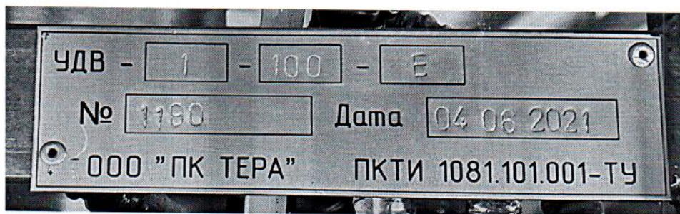
Рисунок 1.2 – Фотография маркировки установки дозирования жидкости весовой УДВ-1-100-Е № 1190