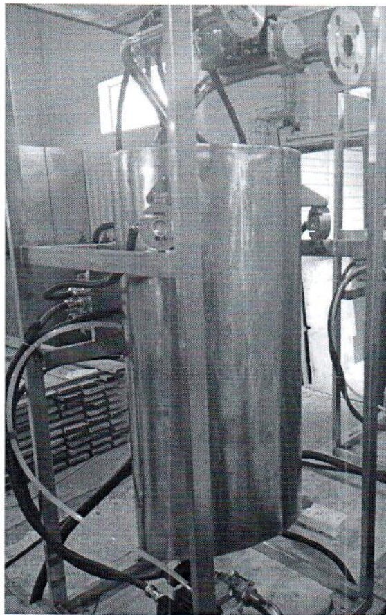
Рисунок 1.1 – Фотография общего вида установки дозирования жидкости весовой УДВ-1-100-Е № 1190