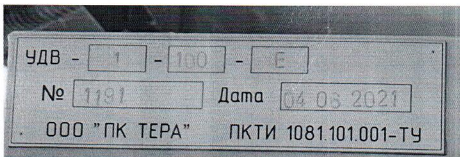
Рисунок 1.2 – Фотография маркировки установки дозирования жидкости весовой УДВ-1-100-Е № 1191