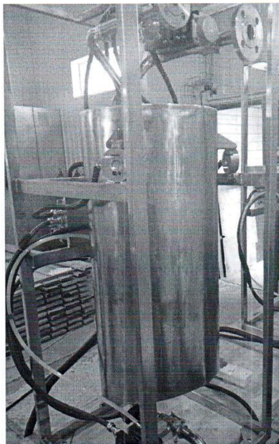
Рисунок 1.1 – Фотография общего вида установки дозирования жидкости весовой УДВ-1-100-Е № 1191