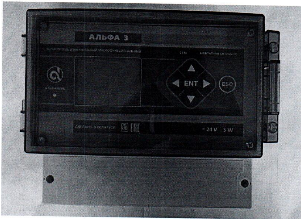
Рисунок 1.1 – Внешний вид вычислителя Альфа 3

Фотографии общего вида средства измерений