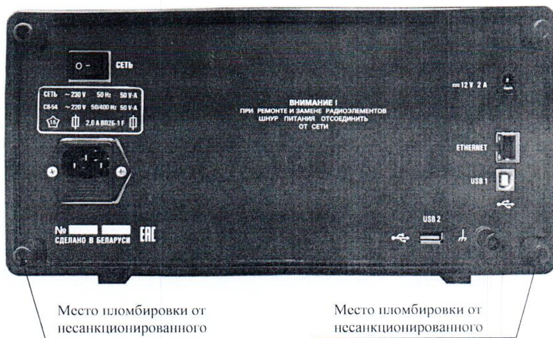
Рисунок 3.1 – Схема пломбировки от несанкционированного доступа