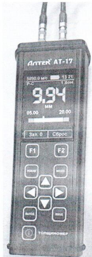
Рисунок 1 - Общий вид электронного блока толщиномеров

Общий вид электронного блока толщиномеров представлена на рисунке 1.