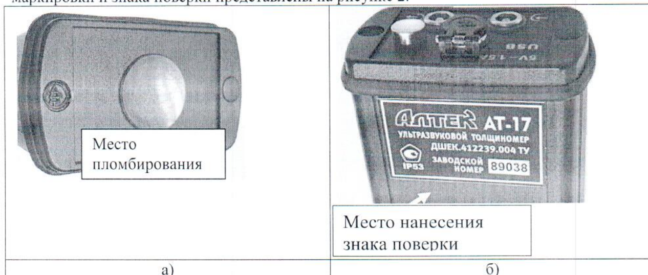
Рисунок 2 - а) схема пломбировки от несанкционированного доступа б) обозначение места маркировки и знака поверки

Схема пломбировки от несанкционированного доступа, обозначение места нанесения маркировки и знака поверки представлены на рисунке 2.